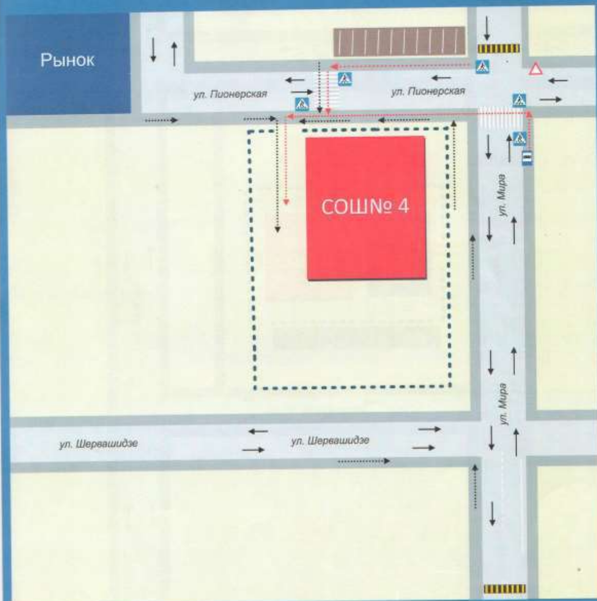
Схема безопасного прохода к МОБУ СОШ №4 города Лабинска Лабинского района по ул. Мира 167