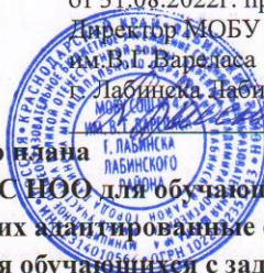
Таблица-сетка часов учебного плана начального общего образования в рамках ФГОС НОО для обучающихся с ОВЗ общеобразовательных учреждений, реализующих адаптированные образовательные программы начального общего образования для обучающихся с задержкой психического развития (вариант 7.1) муниципального общеобразовательного бюджетного учреждения средней общеобразовательной школы №4 имени участника Великой Отечественной войны Вареласа Владимира Георгиевича города Лабинска муниципального образования Лабинский район, на 2022-2023 учебный год